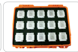
Cartridge Carrying Case